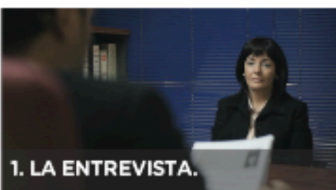
1. LA ENTREVISTA.