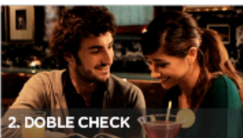
2. DOBLE CHECK