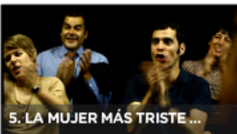
5. LA MUJER MÁS TRISTE ...